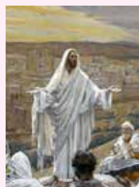
"Lo Spirito darà testimonianza di me".